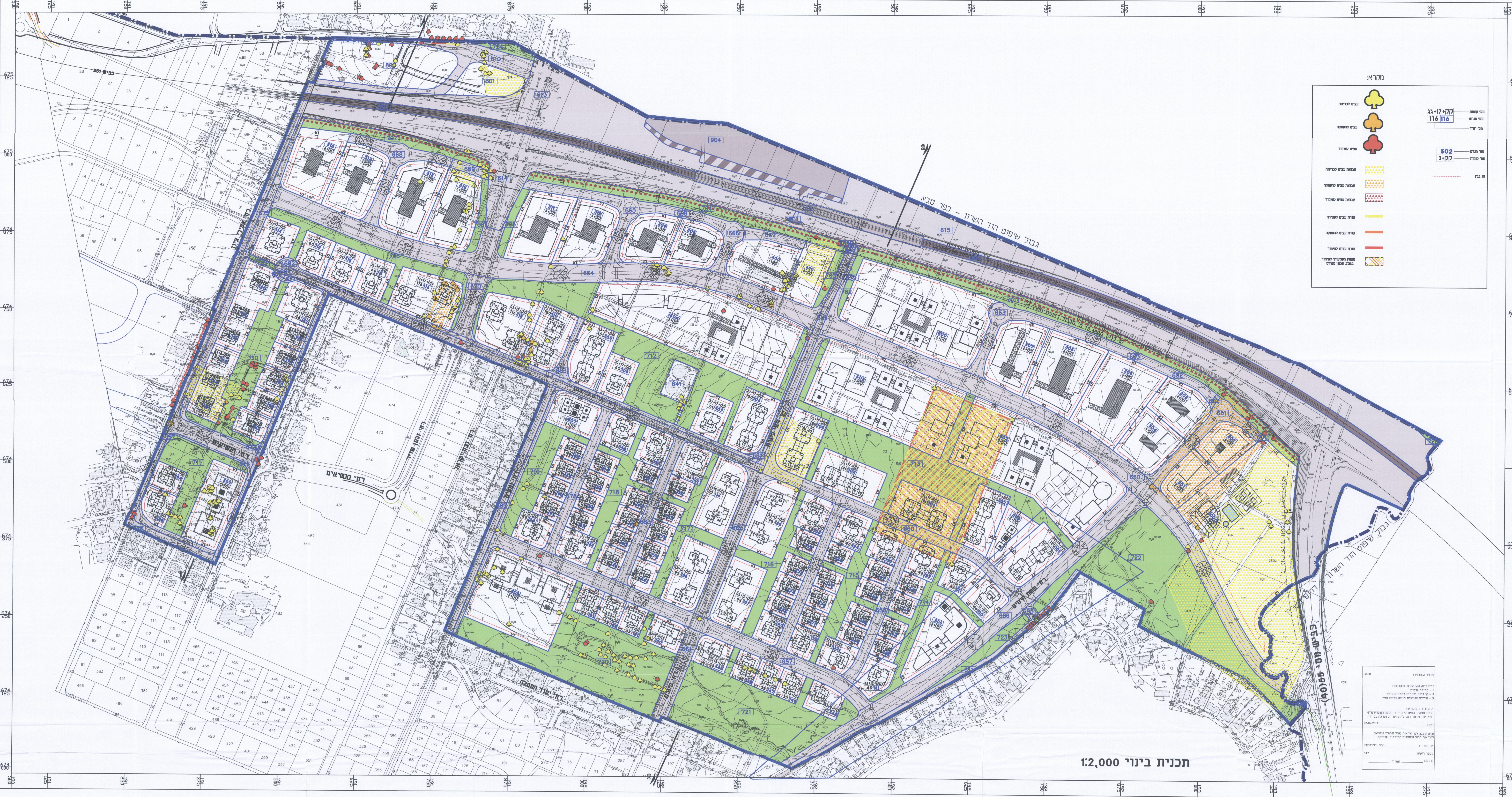
תכנית בינוי 1:2,000