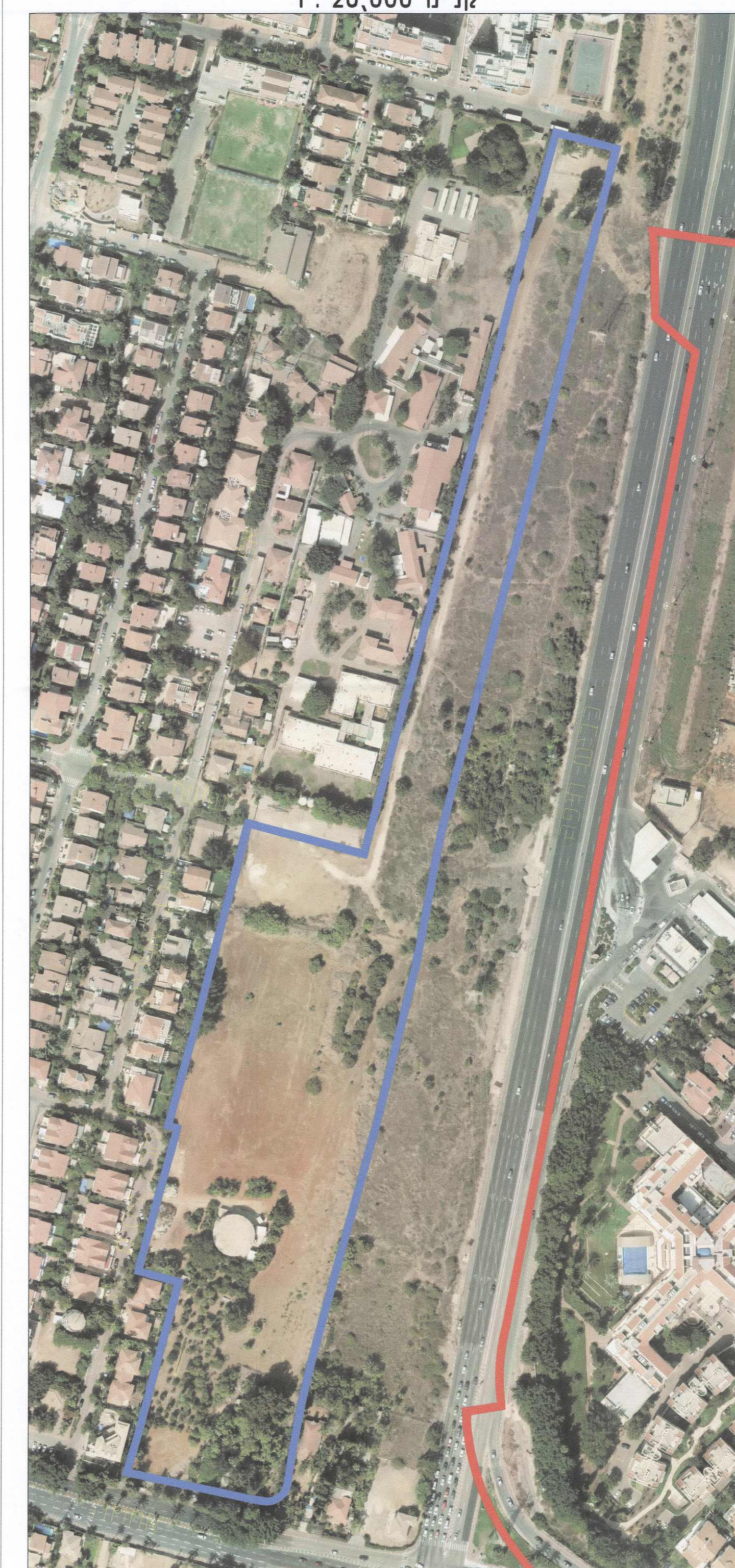
תצ"א אפריל 2013 קני"מ 1:2,000